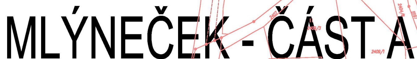
MLÝNEČEK M=1:500 - ČÁST A